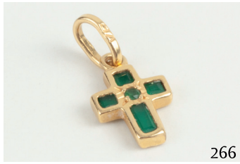
Cruz de oro con esmeraldas.