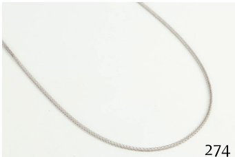
Cadena de oro blanco.