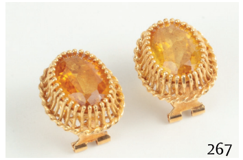
Pendientes de oro con cuarzos citrinos.