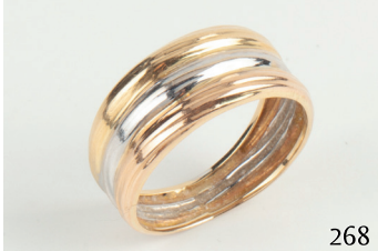
Sortija de oro tricolor.