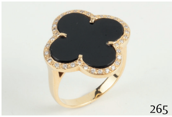
Sortija de oro con onix y diamantes talla brillante. Peso aprox. Dts. 0. 20ct.