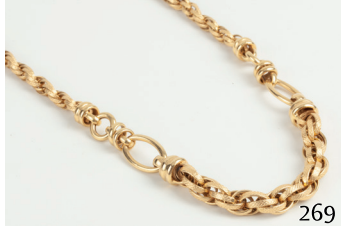
Gargantilla de oro.