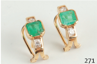
Pendientes de oro con esmeraldas naturales y diamantes talla brillante. Peso aprox. Dts. 0. 24ct.