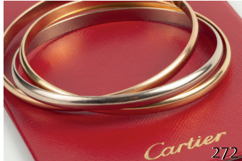
Pulsera Trinity de Cartier. Acompaña documentación. (Marca verificada).