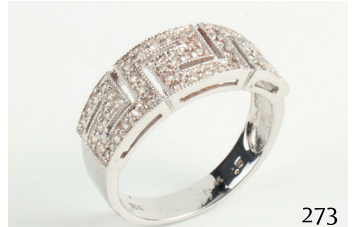
Sortija de oro blanco con diamantes talla brillante. Peso aprox. Dts. 0. 50ct.