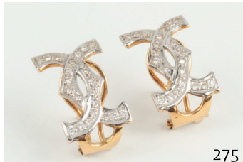
Pendientes de oro bicolor con diamantes talla brillante. Peso aprox. Dts. 0. 50ct.