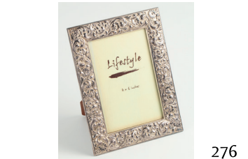
Marco de fotos de plata cincelada.