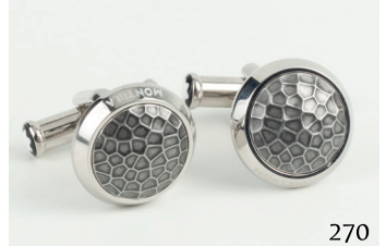
Gemelos de acero marca Montblanc. (Marca verificada).